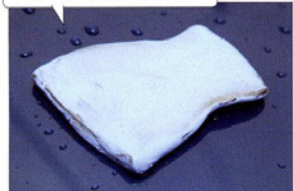
汚れが確認しやすい

あまり同じ面ばかり使うと、ボディにキズがつくので、適量中に折り込んで、新しい面を使いながら、水色のねんどなので、付着した汚れを確認しやすい。目安としては1個のねんどで洗車1〜2回分使える。