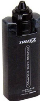
TRIZEX COATING-CARE SHAMPOO