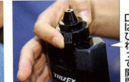
口はひびくって開閉

シャンプーは、水をふくませたスポンジに直接つけて使うことができる。スポンジを数回軽く握ってやるだけでも、よく泡だてられる。また、比較的にきめ細かい泡ができていくような気がする。