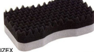
TRIZEX PREMIUM SPONGE