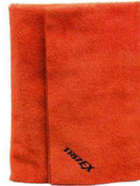
TRIZEX PREMIUM CLOTH