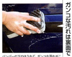
ガンコな汚れは裏面で

バンパーの下のほうなど、ガンコな汚れがこびりついている箇所は、やわらかい面だと心もとない。そこで、固いほうの面に持ち替えてゴシゴシこすってやれば、力強く汚れを落としてくれる。