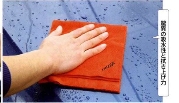
驚異の吸水性と拭き上げ力

トリガーヘッドの視覚部分にレバーがあって、そこをひねることでトリガーのロックができる。しもうときや、保管しておくときにも、液が出ないようにすることがおこなうので安心だ。