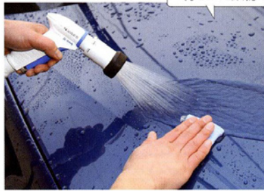
刺さった鉄粉をばっちり除去

あまり同じ面ばかり使うと、ボディにキズがつくので、適量中に折り込んで、新しい面を使いながら、水色のねんどなので、付着した汚れを確認しやすい。目安としては1個のねんどで洗車1〜2回分使える。