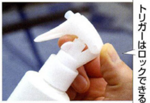
トリガーはロックできる

コーティング剤の塗布は、おどろくほど簡単。濡れたままの塗装面にスプレーするだけでいいのだ。ポンネットだけで5〜6センチでいいので少量でもOK。あとは拭き上げるときに、やや塗り広げながらやるといい。