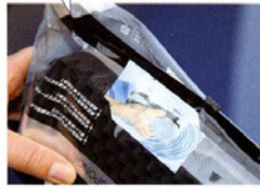
ケースはジッパーつき

スポンジはビニールのケースに入っているが、比較的丈夫な材質で、ジッパーで開閉できる。したがって、使い終わったらまたこのケースに収納することもできそうだし、細かいところだが、ありがたい配慮である。