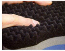
凹凸面は意外なやわらかさ

バンパーの下のほうなど、ガンコな汚れがこびりついている箇所は、やわらかい面だと心もとない。そこで、固いほうの面に持ち替えてゴシゴシこすってやれば、力強く汚れを落としてくれる。