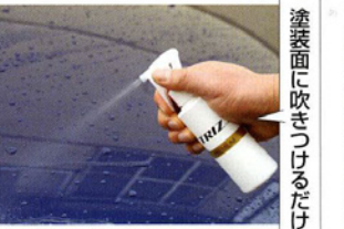
塗装面に吹きつけるだけ