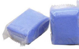
TRIZEX CLAY CLEANER X2