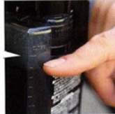
バケツに入れる適量かわかる

シャンプーは、バケツに入れて、水で溶いてでやってもいい。4Lの水に対して、2目盛りぶんを使う。容器が目盛りがついているので適量かわかりやすい。1回につき2目盛りぶんすれば約10回使える。